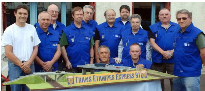
Maquette TEE91 pour le spot TV pour RFF en 2011

Le TEE (91) fera gérer son réseau de 6 mètres par les jeunes également.