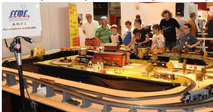
Les jeunes autour du réseau O tôle de l'AMFI au Mondial 2013

L'AMFI exposera dans plusieurs échelles, permettant au public de « jouer au train ».