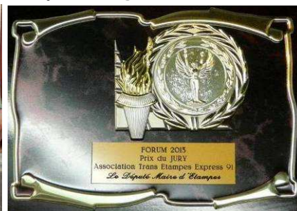
Prix association Etampes 2013