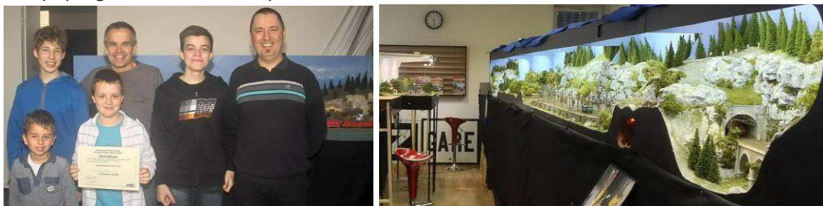
RMC71, club Juniors FFMF - Réseau HO « Savoie » dans le nouveau local RMC71